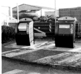
Type Euro tit

Idet jeg henviser til din mail, skal jeg hermed fremsende tilbud på underjordiske affalds container.